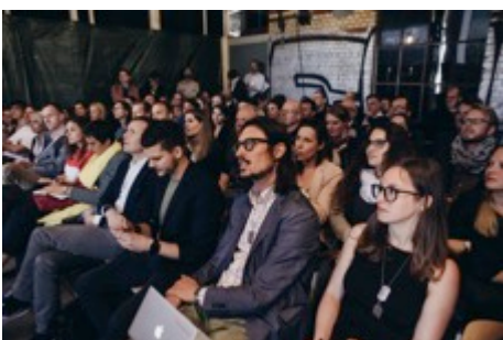
BU: Ungeteilte Aufmerksamkeit der Rekruten