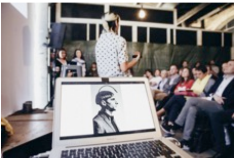
BU: Keynote-Speakerin Moon Ribas „Designing yourself – in search of new senses“